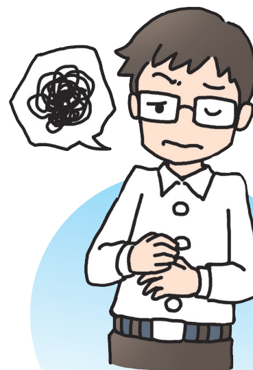
胃がムカムカする